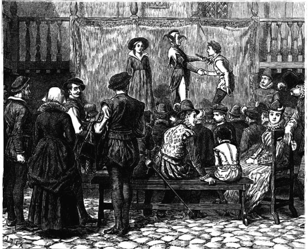
A PLAY IN A LONDON INN YARD, IN THE TIME OF QUEEN ELIZABETH.

From Thornbury's Old and New London , Cassell & Co, 1881.